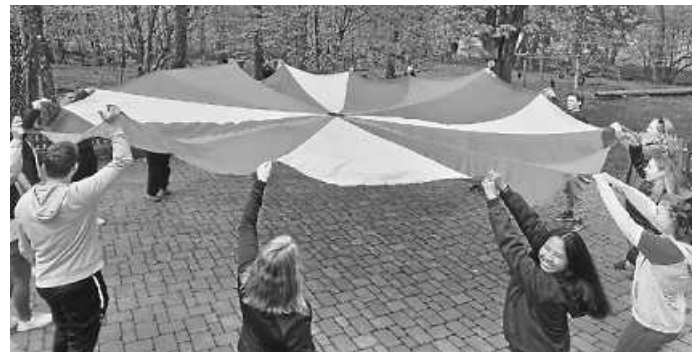
Bei der Naturfreundejugend Baden kommen Spiel und Spaß für die Teamer*innen nie zu kurz!

Dann hol Dir alle Infos und melde Dich an unter: www.naturfreundejugend-baden.de oder ruf uns direkt an. Werde Teil der Naturfreundejugend Baden und mach 2025 zu Deinem Jahr!