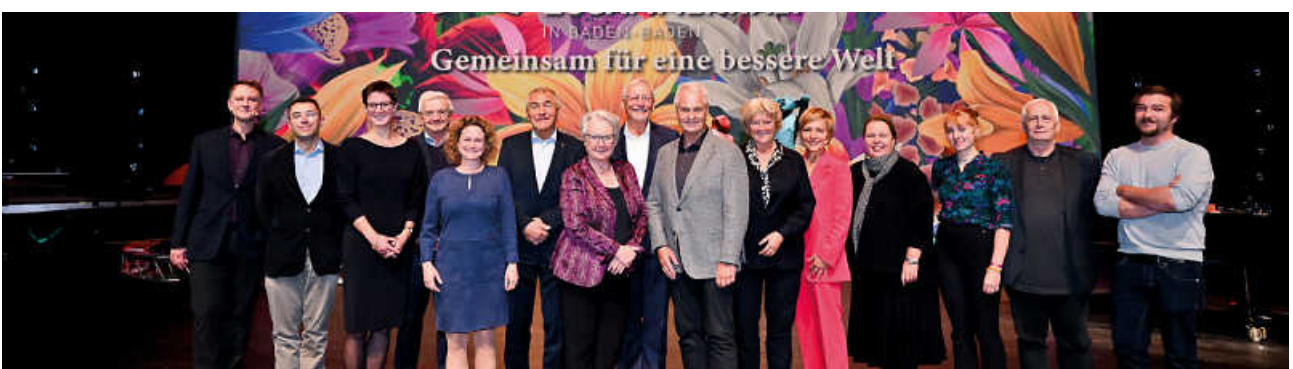
Impressionen vom Forum für Gesellschaftlichen Zusammenhalt 2022 in Baden-Baden.

Buchen Sie jetzt Ihre kostenlosen Tickets!