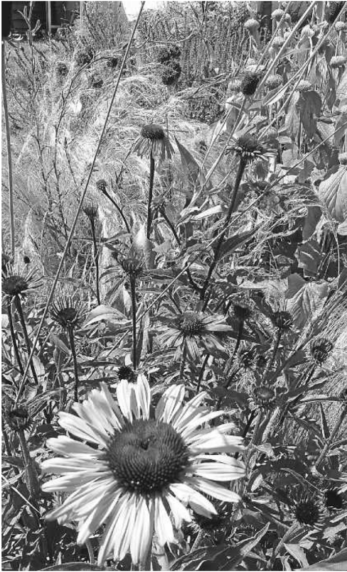
Purpur-Sonnenhut, syrisches Bandkraut und Federgras eignen sich für trockene Lagen wie einen Kiesgarten.